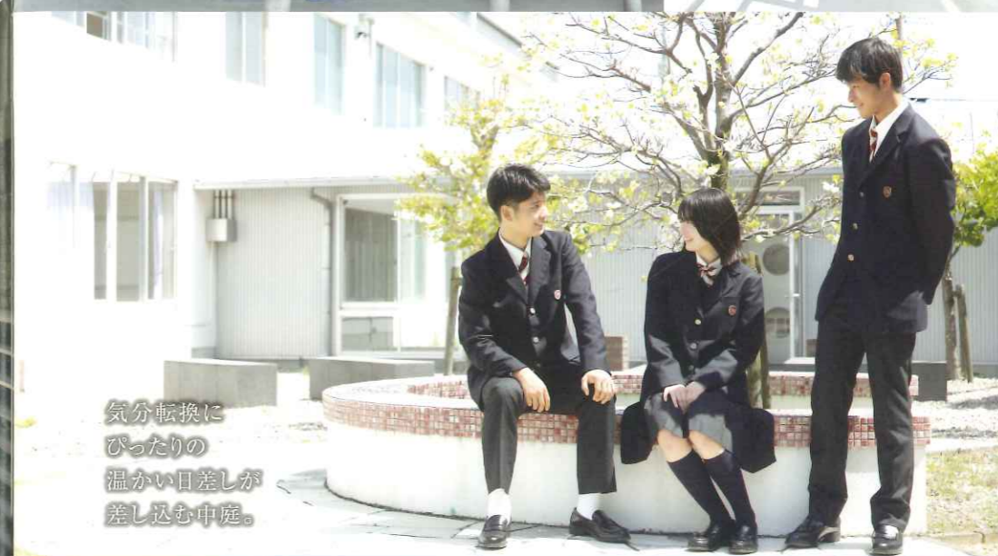
気分転換に びったりの 温かい日差しが 差し込む中庭。