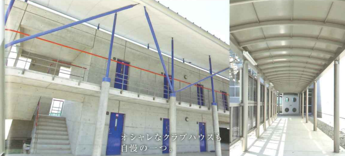
オシャレなクラブハウスも 自慢の一つ。