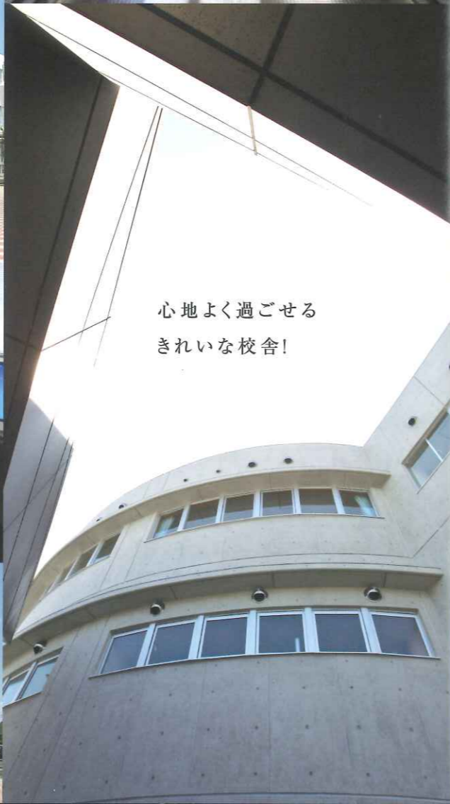
心地よく過ごせる きれいな校舎!