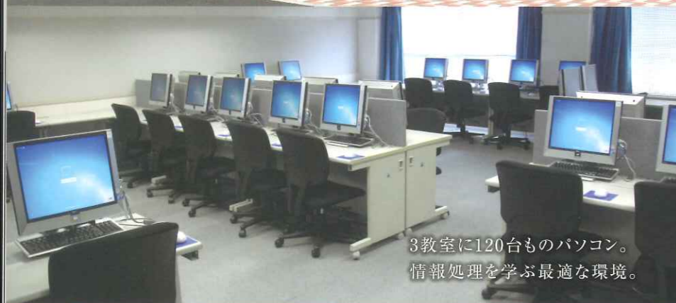
3教室に120台ものパソコン。 情報処理を学ぶ最適な環境。